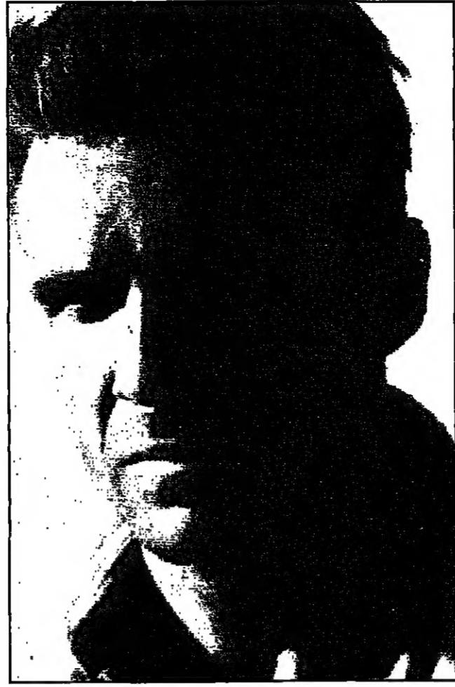
بطلا فيلم المريض الانكليزي: رالف فينيس وكريستين سكوت ثوماس